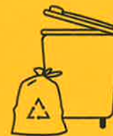
GELBE TONNE & GELBER SACK