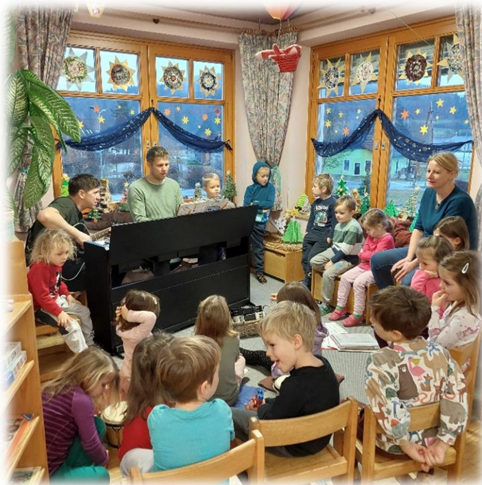
„Gemeinsames Musizieren und Singen“

Durch Patenschaften von Eltern und öffentlichen Personen entstand im Kindergarten eine umfangreiche Bibliothek und Ludothek. Einige Eltern erklären sich immer wieder bereit, einen Büchereidienst zu übernehmen. Somit können unsere Kinder einmal pro Woche pädagogisch wertvolle Bücher und Spiele ausborgen. Auch Eltern haben die Möglichkeit in Erziehungsratgebern und Büchern zu verschiedenen Themen zu schmökern. Der wertschätzende Umgang mit den Materialien ist uns dabei sehr wichtig!