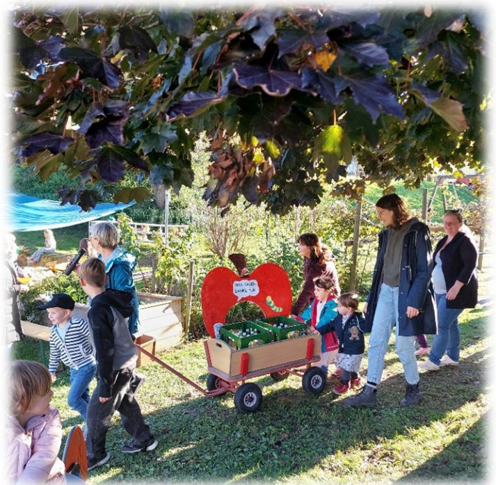
„Erntedank und Kennenlernnachmittag“